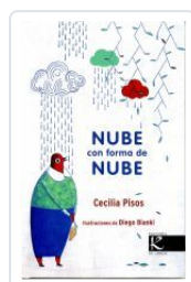
NUBE CON FORMA DE NUBE CECILIA PISOS