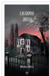
LAS DAMAS JUSTAS ROSANA FONCEA