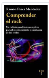
COMPRENDER EL ROCK RAMON FINCA MENEDEZ