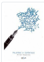
PALAVRAS A ESPARTACO VITOR VAQUEIRO