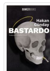
BASTARDO HAKAN GUNDAY