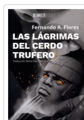
LAS LÁGRIMAS DEL CERDO TRUFERO FERNANDO A.FLORES