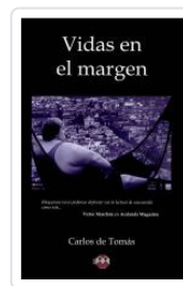
VIDAS EN EL MARGEN CARLOS DE TOMAS