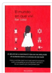
O MUNDO EN QUE VIVÍN ILSE LOSA