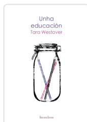
UNHA EDUCACION TARA WESTOVER