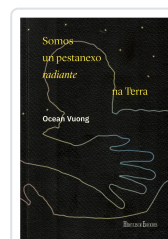
SOMOS UN PESTANEXO RADIANTE NA TERRA OCEAN VUONG