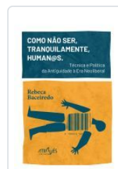
COMO NAO SER, TRANQUILAMENTE, HUMAN@S . TECNICA E POLITI REBECA BACEIREDO