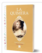
LA QUIMERA EMILIA PARDO BAZAN