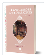
EL CABALLERO DE LAS BOTAS AZULES ROSALÍA DE CASTRO