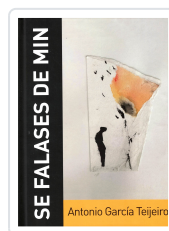
SE FALASES DE MIN (INCL.CD) ANTONIO GARCÍA TEJEIRO