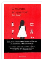
EL MUNDO EN QUE VIVI ILSE LOSA