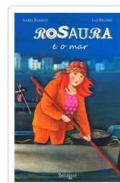
ROSAURA E O MAR ISABEL BLANCO