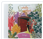
O XARDÍN DAS SETE PORTAS CONCHA CASTROVIEJO