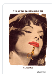
Y TÚ, POR QUÉ QUIERES HABLAR DE ESO LEIROS DE LA PEÑA, PAZ