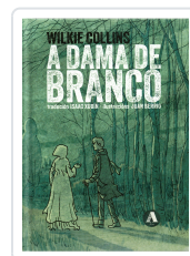
A DAMA DE BRANCO WILKIE COLLINS