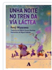
UNHA NOITE NO TREN DA VIA LACTEA KENJI MIYAZAWA