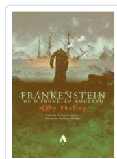
FRANKENSTEIN (TAPA DURA) MARY SHELLEY