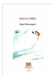
VENTO FRÍO MANEL MONTEAGUDO