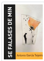
SE FALASES DE MIN (INCL.CD) ANTONIO GARCÍA TEJEIRO