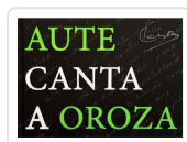
AUTE CANTA A OROZA (LIBRO/CD) Carlos Oroza ; Luis Eduardo Aute