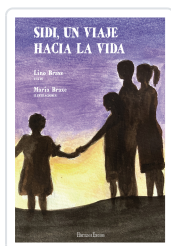
SIDI, UN VIAJE HACIA LA VIDA BRAXE, LINO