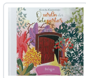
O XARDÍN DAS SETE PORTAS CONCHA CASTROVIEJO