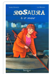
ROSAURA E O MAR ISABEL BLANCO