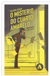
O MISTERO DO CUARTO AMARELO LEROUX, GASTON