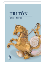
TRITÓN BLANCA RIESTRA