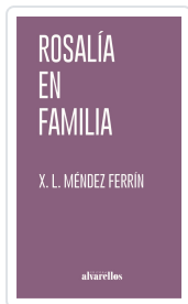
ROSALÍA EN FAMILIA X.L.MÉNDEZ FERRÍN