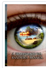
A IRMANDADE DA BANDEIRA BRANCA ANXO MUÍÑOS