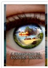
A IRMANDADE DA BANDEIRA BRANCA ANXO MUÍÑOS