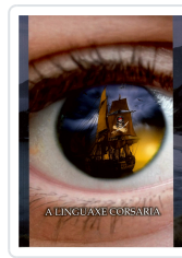
A LINGUAXE CORSARIA ANXO MUÍÑOS