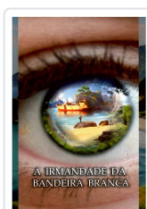
A IRMANDADE DA BANDEIRA BRANCA ANXO MUÍÑOS