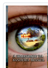
A IRMANDADE DA BANDEIRA BRANCA ANXO MUÍÑOS