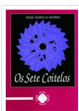
OS SETE COITELOS XOSE AGRELO HERMO