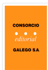
42 DECIMAS DE FEBRE MIRO VILLAR