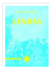
LENDAS GUSTAVO ADOLFO BECQUER