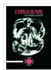
O ESPELLO DE PAPEL ALFONSO COSTA