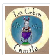
LA CEBRA CAMILA(26º EDICION) MARISA NUNEZ, OSCAR VILLAN(ILU.)