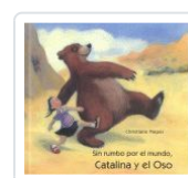
CATALINA Y EL OSO, SIN RUMBO POR EL MUNDO PIEPER, CHRISTIANE