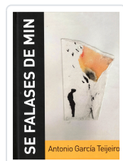
SE FALASES DE MIN (INCL.CD) ANTONIO GARCÍA TEIJEIRO