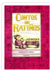
CONTOS DE RATIÑOS ARNOLD LOBEL