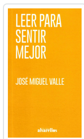
LEER PARA SENTIR MEJOR JOSÉ MIGUEL VALLE