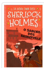
SHERLOCK HOLMES. O SABUXO DOS BASKERVILLE SIR ARTHUR CONAN DOYLE