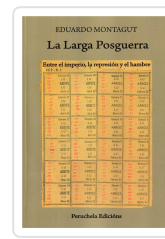
LA LARGA POSGUERRA EDUARDO MONTAGUT