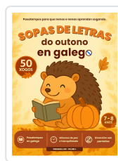
SOPAS DE LETRAS DO OUTONO EN GALEGO DE 7 A 8 ANOS BREIXO MARIÑO MALVIDO