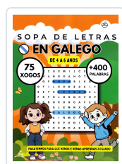
SOPA DE LETRAS EN GALEGO (DE 4 A 6 ANOS) BREIXO MARIÑO