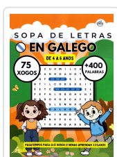
SOPA DE LETRAS EN GALEGO (DE 4 A 6 ANOS) BREIXO MARIÑO