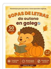
SOPAS DE LETRAS DO OUTONO EN GALEGO DE 7 A 8 ANOS BREIXO MARIÑO MALVIDO