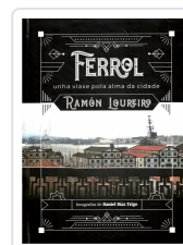
FERROL UNHA VIAXE POLA ALMA DA CIDADE RAMÓN LOUREIRO