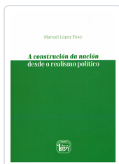
A CONSTRUCCIÓN DA NACIÓN DESDE O REALISMO POLÍTICO MANUEL LÓPEZ FOXO