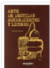
ARTE DE DESTILAR AGUARDIENTES Y LICORES VV.AA.