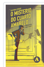
O MISTERIO DO CUARTO AMARELO LEROUX, GASTON