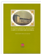
O ANTIGO HOSPITAL DE ESTEIRO CAMPUS UNIVERSITARIO DE FERROL JOSE RAMON SORALUCE BLOND