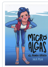
MICRO ALGAS. EL MUNDO OCULTO XULIA PISON