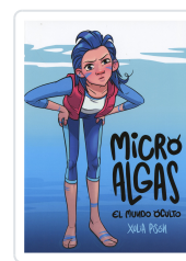
MICRO ALGAS. EL MUNDO OCULTO XULIA PISON