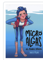
MICRO ALGAS. EL MUNDO OCULTO XULIA PISON