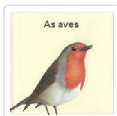
AS AVES CALROS SILVAR