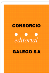
TOPICOS SOBRE A LINGUA GALEGA SUSO FERNANDEZ ACEVEDO