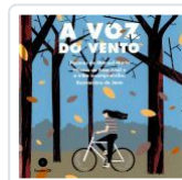
A VOZ DO VENTO (LIBRO CD)(9788460854654-ISBN) VV.AA.