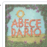
O ABECEDARIO VV.AA.