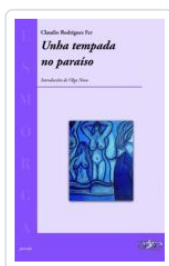
UNHA TEMPADA NO PARAISO CLAUDIO RODRIGUEZ FER