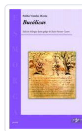
BUCOLICAS PUBLIO VIRXILIO MARON