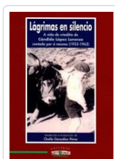
LAGRIMAS EN SILENCIO CANDIDO LOPEZ LORENZO