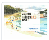
AS ILLAS CÍES XELÍS DE TORO;TAZAB