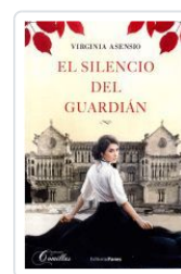
EL SILENCIO DEL GUARDIAN VIRGINIA ASENSIO