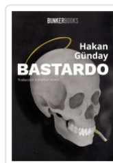
BASTARDO HAKAN GUNDAY