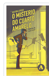
O MISTERIO DO CUARTO AMARELO LEROUX, GASTON