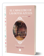
EL CABALLERO DE LAS BOTAS AZULES ROSALÍA DE CASTRO